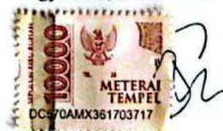
Salsabila As Syifa