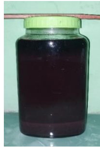
Gambar 7. Proses maserasi

Hasil dari ekstrak kental dilakukan penimbangan dan diperoleh berat ekstrak etanol rimpang kunyit hitam 48,42 gram dan hasil perhitungan rendemen adalah 16,14 %. Adapun tabel hasil rendemen ekstrak etanol rimpang kunyit hitam dapat dilihat pada Tabel 3.