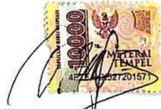
Try Ayu Setiyaningsih