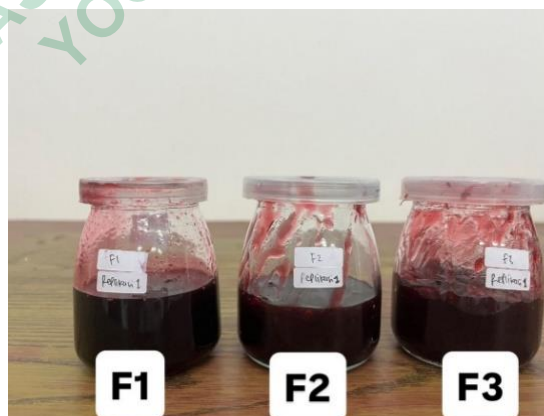
Gambar 9. Sediaan Gel

Tampilan visual sediaan gel facial wash ekstrak bunga rosella dari F1, F2, dan F3 dapat dilihat pada Gambar 9.