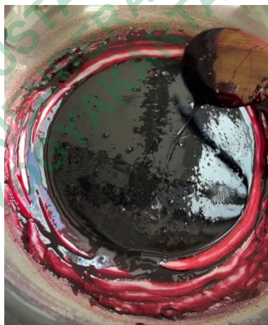
Gambar 8. Ekstrak Bunga Rosella

Tabel 3 menunjukkan bahwa hasil karakterisasi ekstrak pada uji organoleptik didapatkan warna merah kehitaman, berbentuk kental, dan bau yang khas bunga rosella, penetapan kadar air diperoleh sebesar 1,34%. Ekstrak yang diperoleh memenuhi syarat kadar air yaitu >10\% (Fikayuniar et al. , 2023).