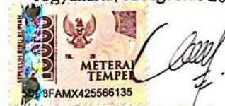
Putri Komala Dewi