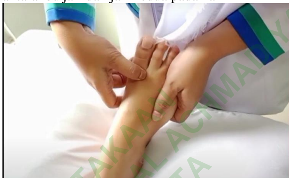
Gambar 4. 3 Titik Pijat 3