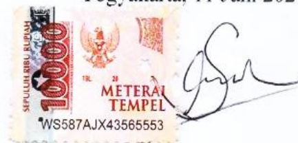
Sintia Wati Harmain